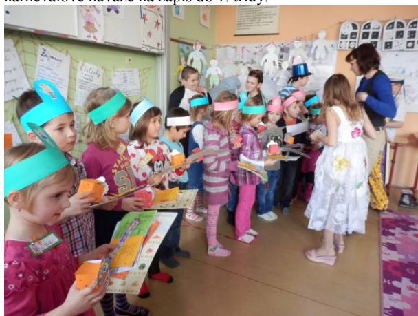
16 dětí u zápisu do 1. třídy

K zápisu do 1. třídy přišlo letos 16 dětí. Konal se v duchu Karnevalu. Pomáhali při něm žáci 5. třídy ve slušivých maskách a na plnění úkolů k posouzení školní zralosti si je rozdělily paní učitelky: Pirátka, Čarodějnice, Sněhurka a Vodní víla. Těšíme se na naše prvňáčky – 1. září při slavnostním zahájení školního roku 2015/2016, který karnevalově naváže na zápis do 1. třídy.