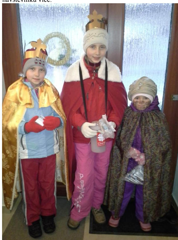
Ještě jednou Tříkrálová sbírka

Proměnlivé počasí a nastupující chřipková epidemie, přece jen trochu ovlivnily návštěvnost. Věříme, že příští rok, třeba už v zateplené a rekonstruované sokolovně, bude opět návštěvníků více.