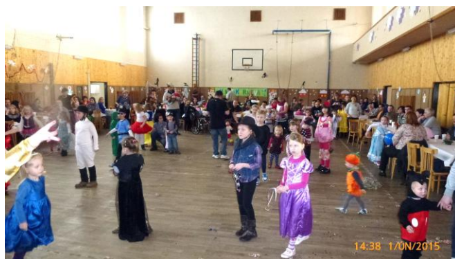
Plný sál rodičů a veselých masek.

Děkujeme všem účastníkům plesové sezóny za podporu všech spolků, organizujících pěkné kokorské plesy, za dary do vyhlášených tombol a dalších slosování, ale hlavně za účast, za aktivní, veselý, ale důstojný nástup do nového roku. Jsme společně velmi rádi, že se naše obec může i takto prezentovat na velmi slušné společenské a kulturní úrovni. Dr. Lő