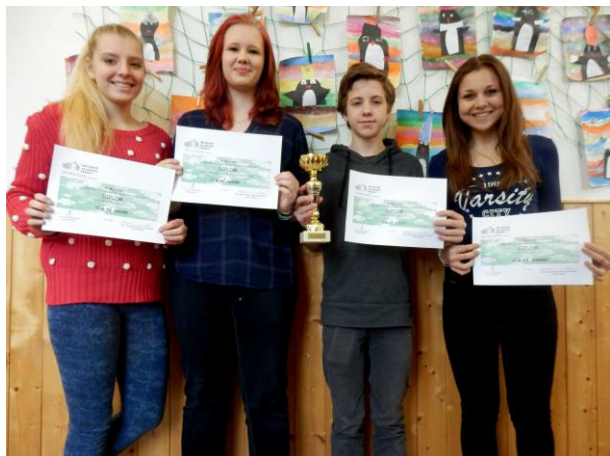
S pohárem primátora a s diplomy.