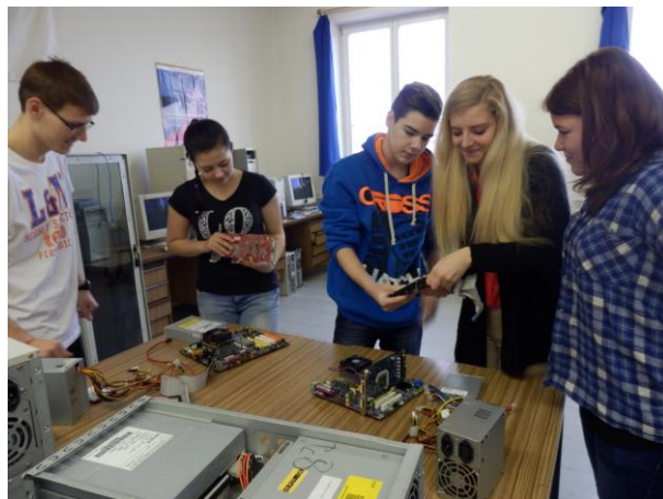
Na průmyslovce v Přerově