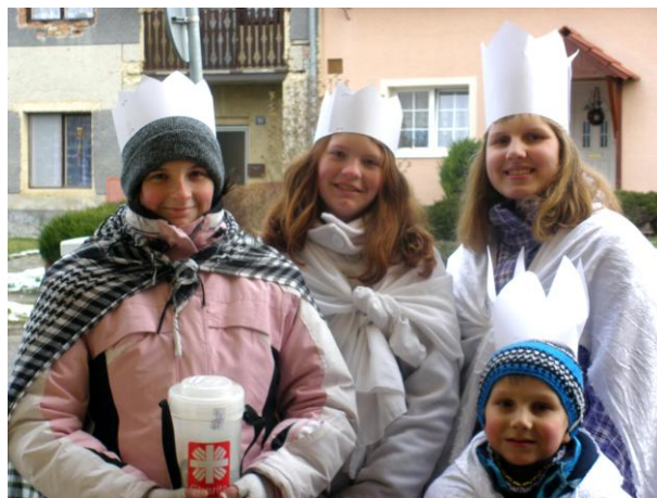
Tři královny, malý král se teprve zaučuje.

I v dalších dnech ve druhé polovině února bylo v noci mrazivo, ale přes den se za slunečního svitu a teplotách hodně nad nulou dalo říci. „předjaří už je tady“. Na to, zda se zima už opravdu vzdala, si ovšem ještě počkáme. Kš